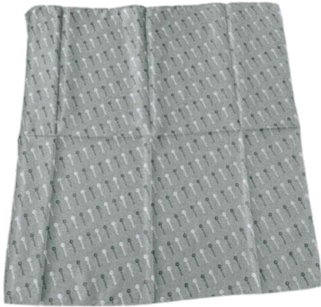
ผ้าพันคอพนักงานการโดยสารหญิง